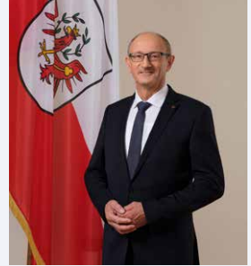
Anton Mattle Landeshauptmann von Tirol

Ich wünsche allen Mitwirkenden viel Freude und dem Publikum unvergessliche, inspirierende und klangvolle Stunden in Lienz!