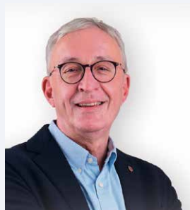
Anton Mattle Landeshauptmann Tirol Ehrenschutz Lange Nacht der Chöre in Landeck